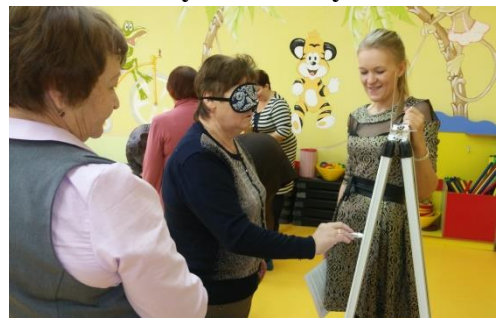
Рисуем в слепую