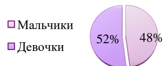
Контингент детей по гендерному принципу (2021-2022 уч.г.)